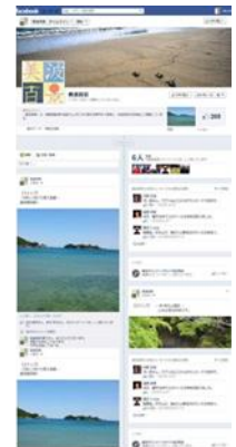
観光体験型アプリ「美波百景」(左) Facebook ページ「美波百景」(右)