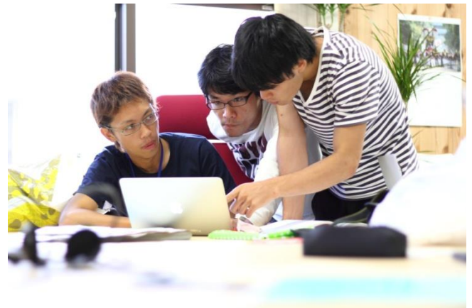
<2012年度開催時の様子>

「アプリ開発合宿 in 美波 Lab」は、“ICT の力で地方の課題を解決せよ！”のテーマのもと、ICT 業界を目指す学生を対象に、人口減少や高齢化などに直面する地方の課題解決に繋がるアプリケーションを企画・開発する合宿型の夏期インターンシップ研修です。