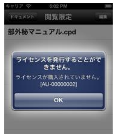
認証エラー画面イメージ ※開発中のものであり実際とは異なる場合がございます。

iOS ver5 以上（iPhone、iPad、iPod touch） ※言語設定が日本語以外の場合、メッセージ英語表記に対応