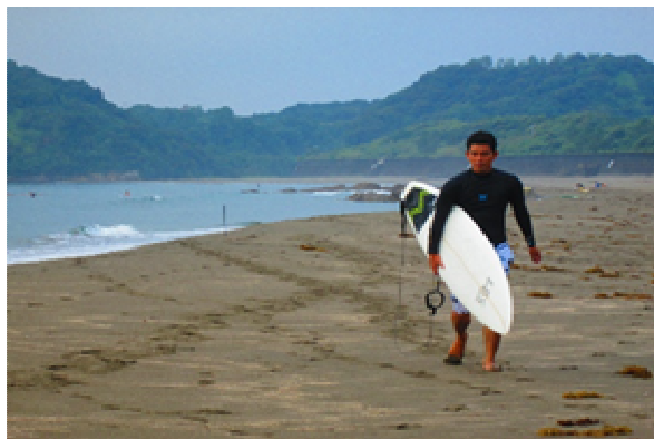
サーフィンを楽しむために首都圏から移住してきたエンジニア

その結果「美波Labで働きたい」「そのような働き方を提唱する企業で働きたい」という人材の応募が増えるとともに、社員増員により事業機会の拡大につながり、「美波Lab」開設以前と比べて社員数は約3倍になり、そして業績も順調に推移するに至りました。