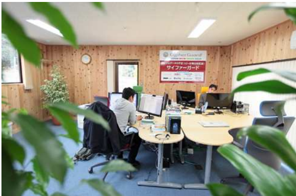
サイファー・テック「美波Lab」

そして「美波Lab」での働き方・暮らし方として、自然豊かな地域でアウトドアなどの趣味を存分に楽しむことで、常にリフレッシュした状態で業務に取り組んだり、時間の使い方を意識したりするなど、趣味や地域での活動と業務とを両立させるスタイル「半×半IT（×は個人の趣味や生活）」を提唱いたしました。